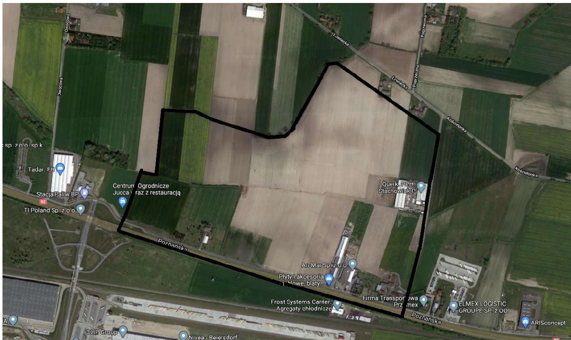
teren objęty miejscowym planem zagospodarowania przestrzennego

przebiega linia elektroenergetyczna średniego i niskiego napięcia. Obszar planu graniczy z zabudową usługową, przemysłową oraz terenami rolnymi.